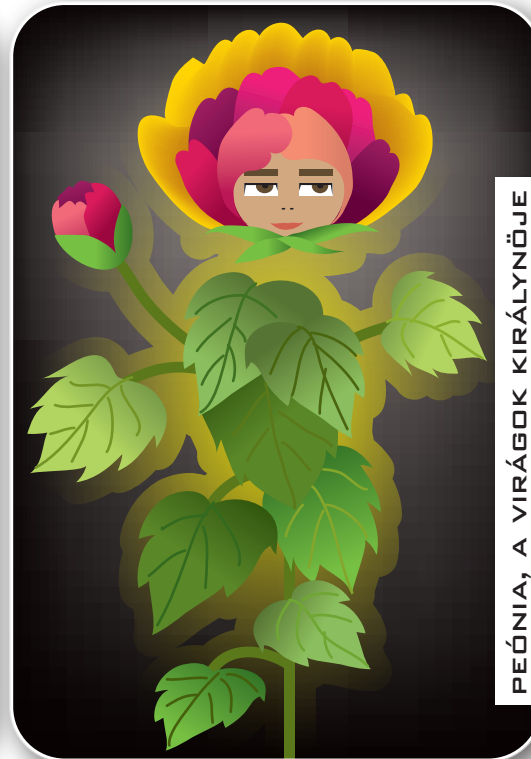
PEÓNIA, A VIRÁGOK KIRÁLYNŐJE

Az iszaptól felövő, de mégis szennytől mentes, a víz felszínén virágot bontó lótusz a tisztaság, a becsületesség, valamint a tökéletes személy jelképe. A növény törekény szépsége és harmóniája miatt kedvelt díszítőmotívuma a festészetnek, ahol gyakran, mint istenségek trónusa szerepel.