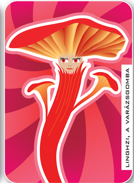
LINGHZI, A VARÁZSGOMBA

A szirmok tövével bíbor folttal ábrázolt, méltóságot sugárzó elegáns növény a peónia, magyarul bazsarózsacserje. Míg a krizantém az ősz jelképe, a peónia a tavaszt jelképezi, népszerűsége okán a virágok királynőjének nevezik, amely egyben az egészség szimbóluma is. Festmények, kerámiák, textilek hagyományosan kedvelt motívuma.