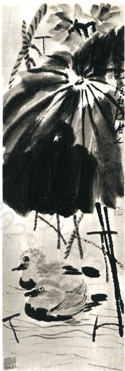
Csi Paj-si : Lótusz és Jüanjang-kacsák