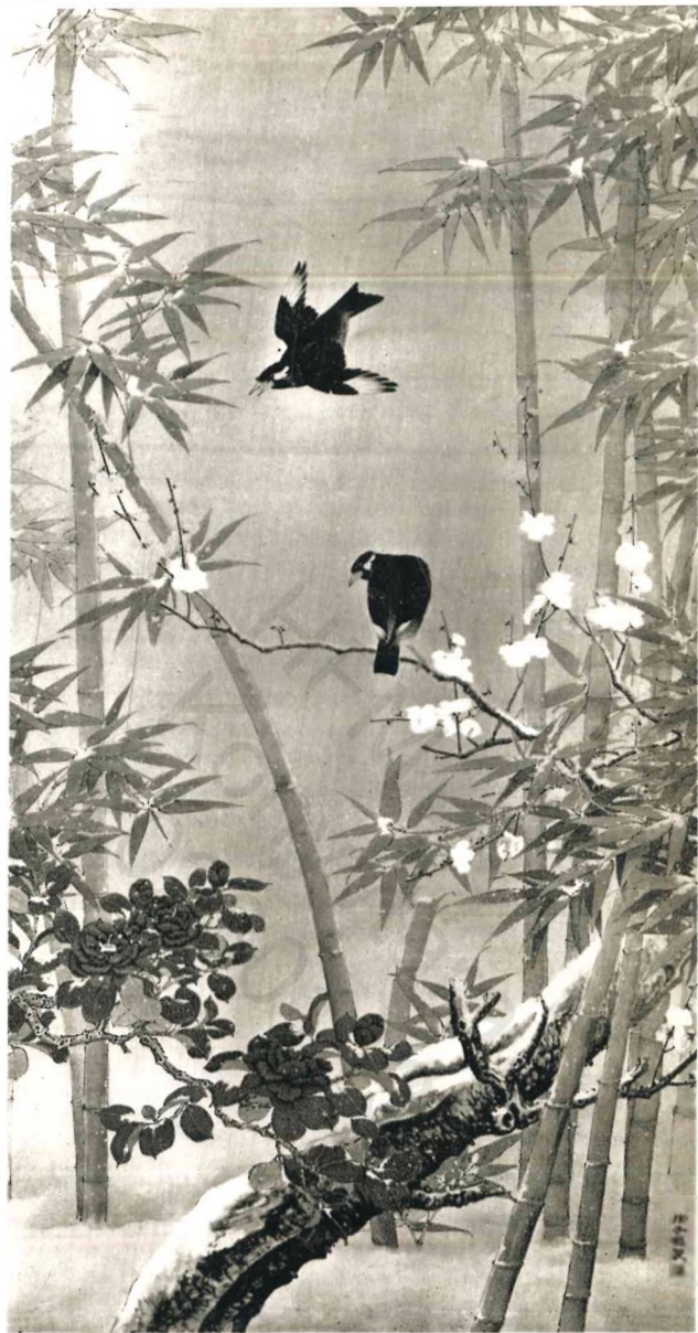
Hszü Ce-hao : Az áldásos hóesés gazdag termést ígér