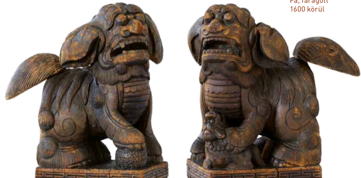
Fo-orszlánok Fa, faragott 1600 körül

Ha nyitott szemmel jársz a városban, látni fogod, hogy a kínai üzletek, éttermek bejárata előtt is gyakran üldögél ilyen állatpár. Most már tudni fogod, milyen élőlényeket ábrázolnak valójában!