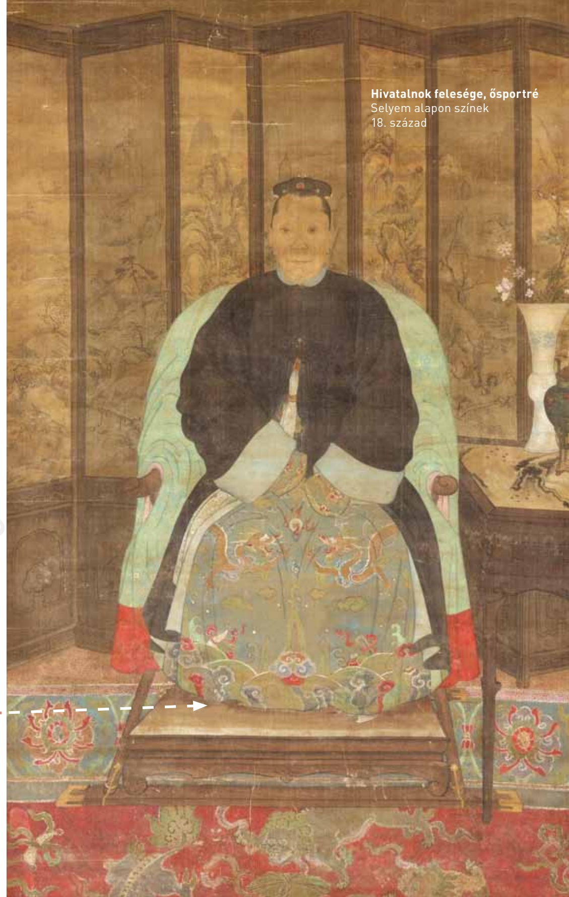
Hivatalnok felesége, ősportré Selyem alapon színek 18. század