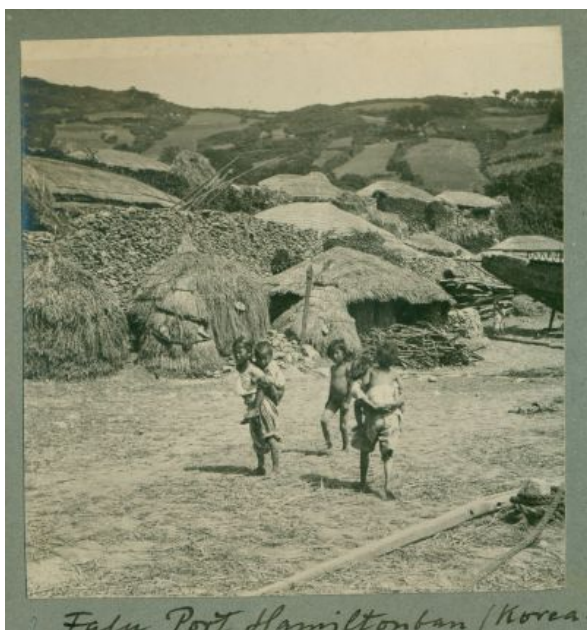
Falu Port Hamiltonban (Korea)

készítés helye: Port Hamilton vagy Komundo (거문도)